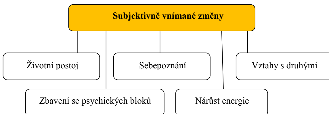
Obr. č. 2: Subjektivně vnímané změny po absolvování obřadu s ayahuaskou

Jedna respondentka také zaznamenala pozitivní vliv na svou uměleckou tvorbu, uvedla, že začala více tvořit. Několik účastníků se shoduje na tom, že se jim změny v životě začaly dít už od chvíle, kdy se rozhodli, že na ayahuaskový obřad půjdou.