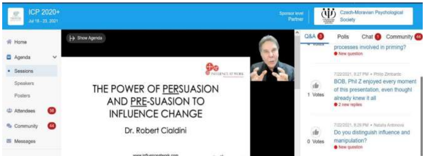
Obr. 6 Přednáška Roberta Cialdiniho