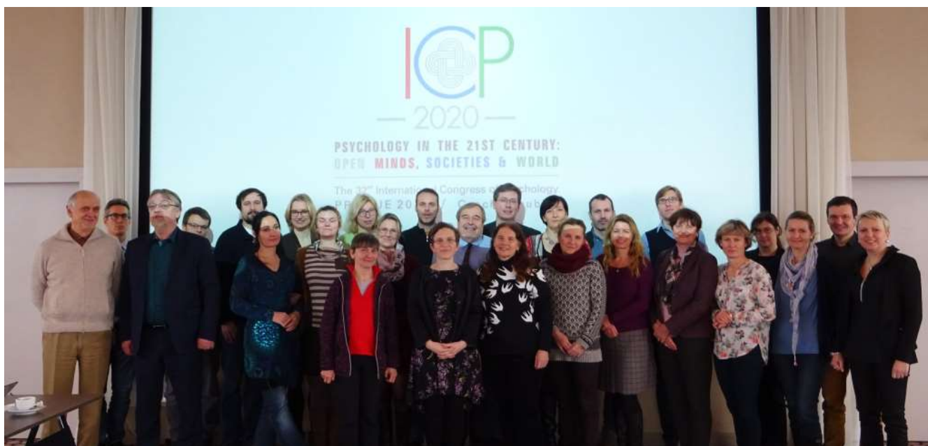
Obr. 2 Vědecký výbor ICP 2020, 28. 1. 2018