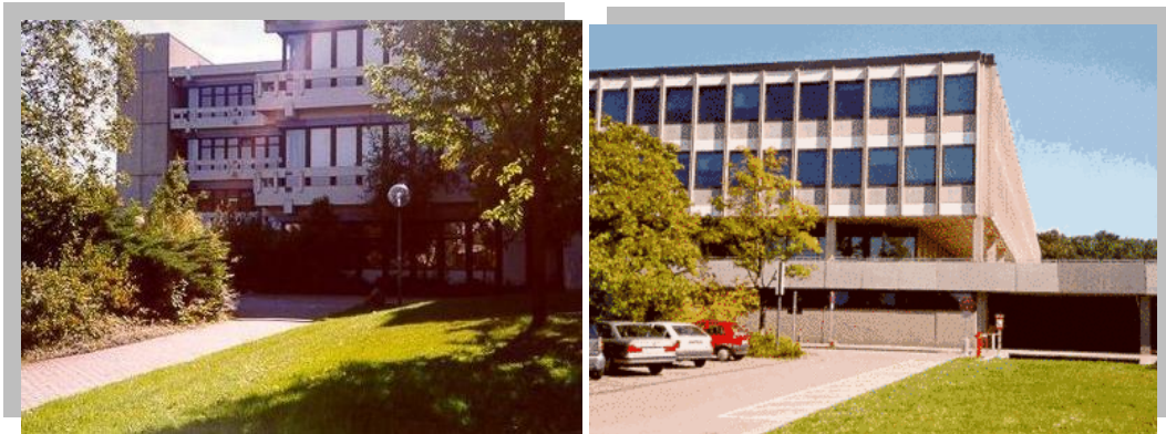
Pädagogische Hochschule Ludwigsburg

V dňoch 1. - 5. apríla 2009 sa v nemeckom Ludwigsburgu konal na pôde Pädagogische Hochschule vzdelávací kurz s názvom „Successful Transitions“. Určený bol najmä pre pedagógov a psychologov materských, základných a vysokých škôl, ktorí pracujú s deťmi. Zúčastnilo sa ho osemnásť pedagógov základných a vysokých škôl z Rakúskej republiky, Nemeckej spolkovej republiky, Švédskeho kráľovstva, Lotyšskej republiky, Českej a Slovenskej republiky, ako aj dve úradníčky ministerstva školstva v Írsku.