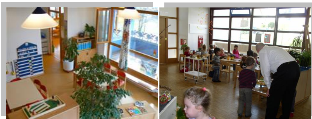
Kindergarten Schwalbennest Ludwigsburg