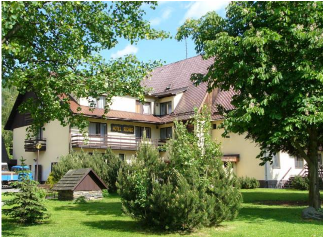
Hotel Reoneo, Vernířovice

Poslední květnový víkend uspořádala Sekce psychologie zdraví ČMPS již tradičně svou konferenci v příjemném prostředí Jesenicka. Budova hotelu Reoneo, v němž se konference konala, nabízela ubytování a kromě jídelny i dva nezávislé sály pro jednání v sekcích.