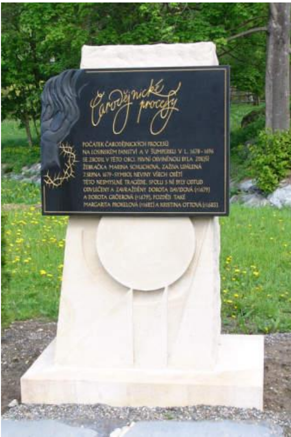
Začátek neblahých čarodějnických procesů