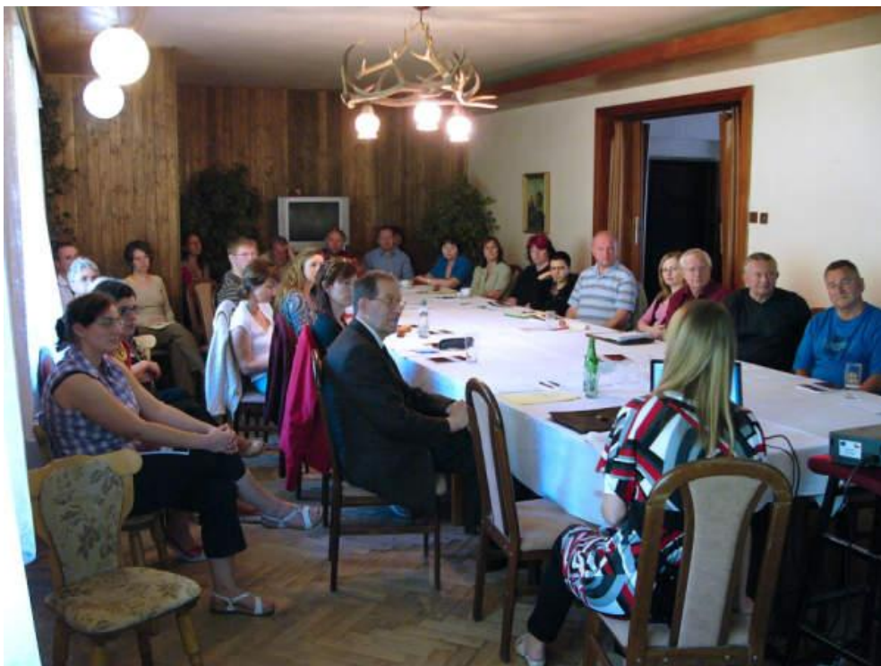
Auditorium při jednání v sekcích