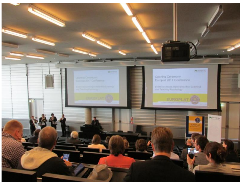
Obr.1 Uvítání na konferenci

Osobně doufám, že kolegů angažovaných pro výuku psychologie bude už jen přibývat, a že s některými z nich se potkáme i na brněnské konferenci Učíme psychologii/Teaching psychology 19. října 2017.